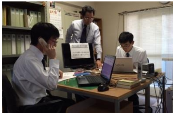
<電話受付・相談及び処理>

大震災の被災県である宮城県では、「復興の加速化による建設労働者の長時間・過重労働、労働災害の多発、社会・労働保険の未加入問題など」諸々の課題が山積する中、一部の建設企業においては、速やかなる労務管理の適正化が求められるところであります。